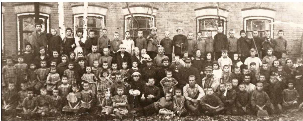
Кузнецкая школа - коммуна имени III Интернационала. 1927 год.

Среди коллекции фотографий Т. В. Семеновой периода становления советской школы в Кузнецке , интерес вызывают групповые фотографии: коллективов учителей и учащихся I класса Кузнецкой смешанной гимназии (1918 год), Кузнецкой единой трудовой школы II ступени (1923 год), первого детского городка (Кузнецк, 1925 год), здания школы крестьянской молодежи I ступени (Фески, 1926 год), Кузнецкой школы – коммуны имени III Интернационала (1927 год), единой трудовой школы I ступени Наркомата путей сообщения (Сад-город, 1928 год). Отдельные из фотографий этого периода переданы музею частными лицами, самими участниками событий или их родственниками.