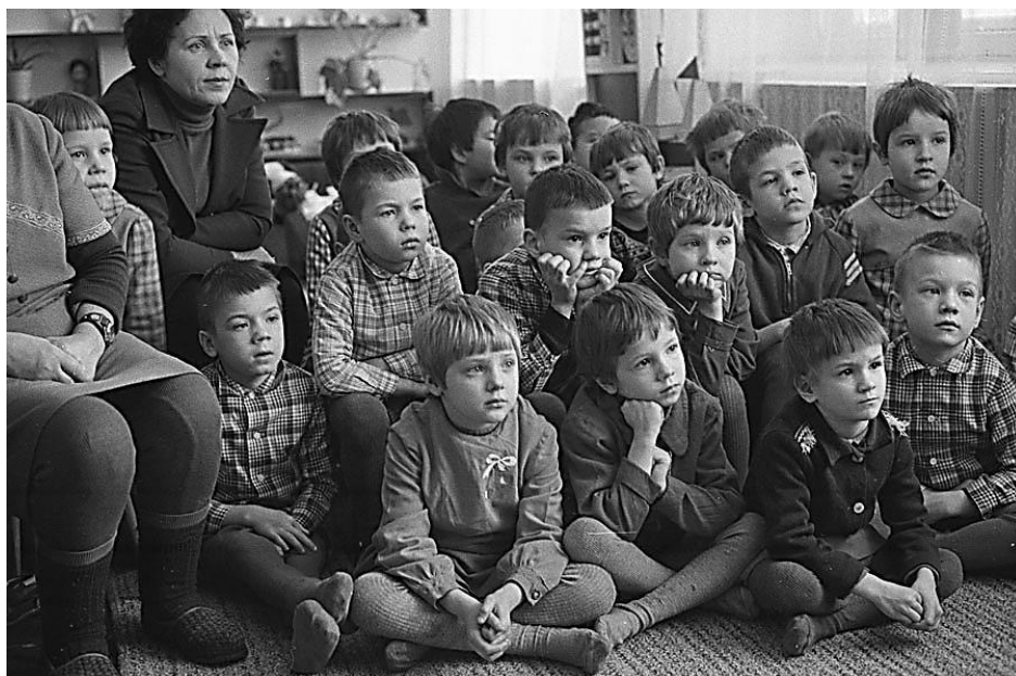
Просмотр похорон Генерального секретаря ЦК КПСС Юрия Андропова группой первоклассников. Детский дом № 5. Новокузнецк, 1984.