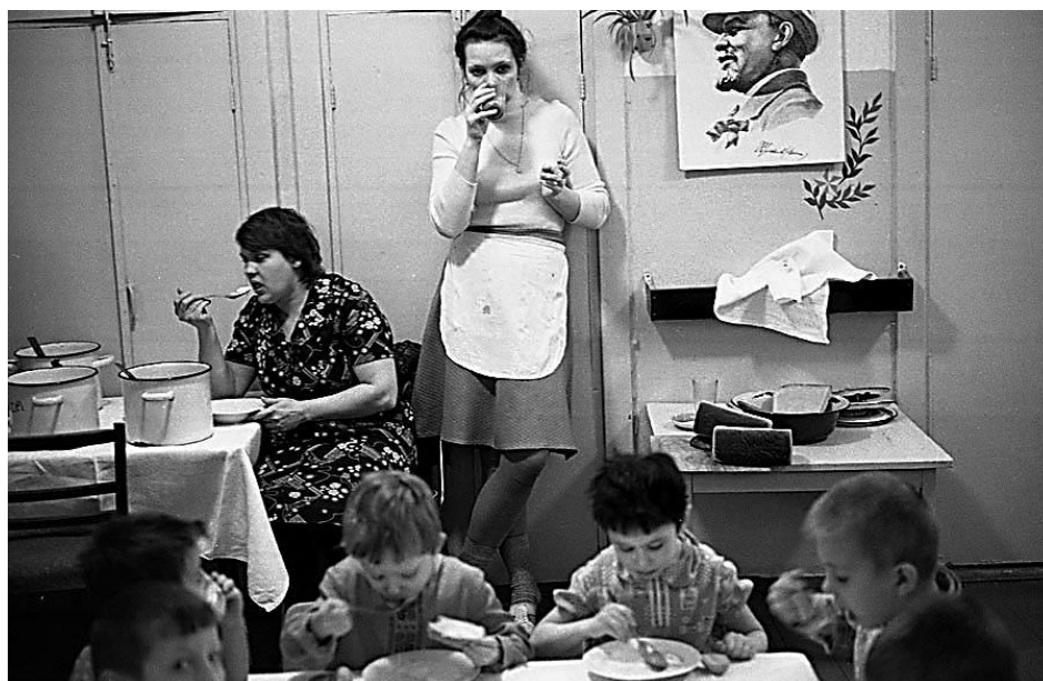
Обед в детском доме. Новокузнецк, 1984.

Основными героями в творчестве фотогруппы были завод и рабочий человек.